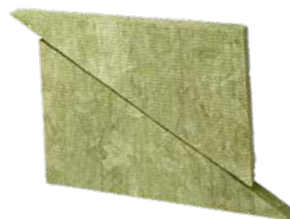
Rockwool Rockroof Delta