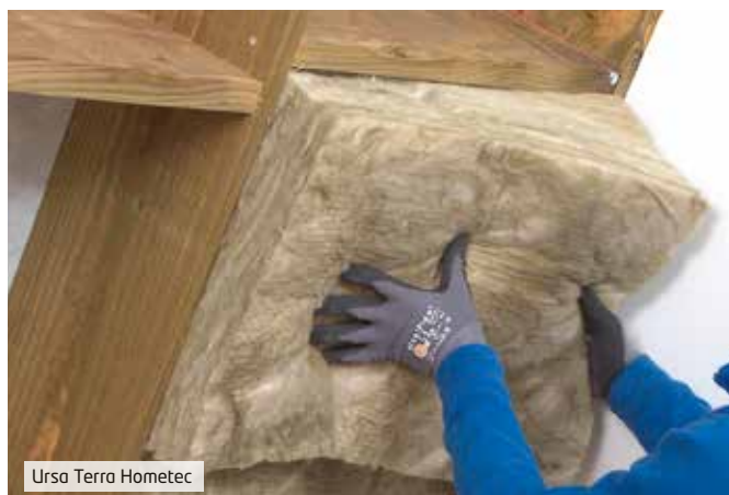
Ursa Terra Hometec