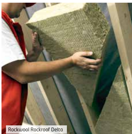
Rockwool Rockroof Delta

Suffit pour toute distance entre les chevrons jusqu'à 60 cm.