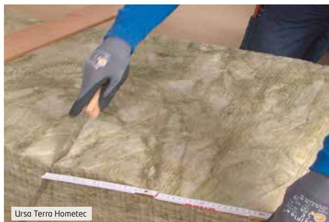
Ursa Terra Hometec