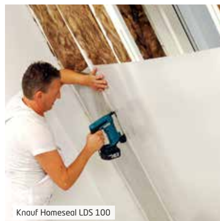
Knauf Homeseal LDS 100